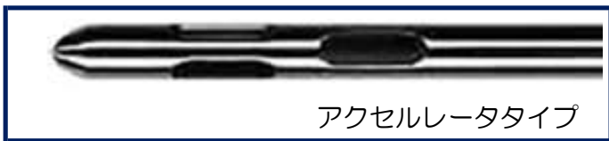
アクセルレータタイプ

アクセルレータタイプ：トライアングル状に穴が3つ開いているタイプで最もポピュラーなデザインです。